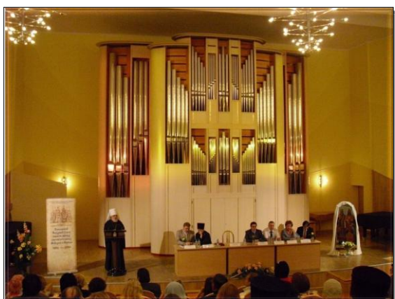
Открытие Прикамского народного Собора в органном зале. Высокопреосвященнейший Мефодий, митрополит Пермский и Соликамский.