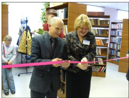
Торжественное открытие библиотек №6 и 32

В городе Перми работает 41 муниципальная библиотека. В 2010 году справили новоселье библиотеки в микрорайонах Левшино (ул. Социалистическая,4) и Балатово (ул. Мира, 84).