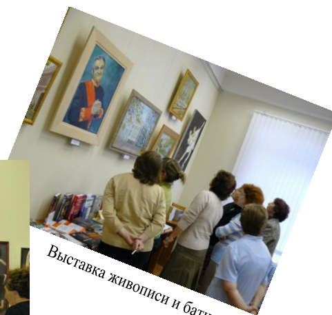
Выставка живописи и батика