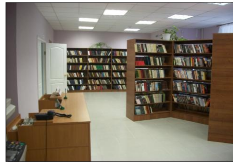
Один из залов библиотеки № 6