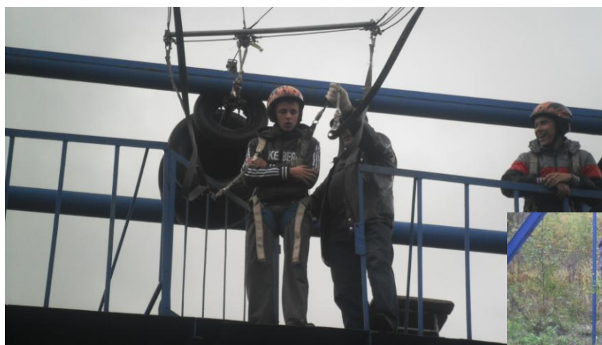
Прыжок и удачное приземление