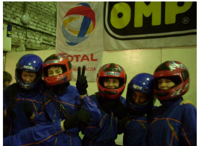
Первая шестерка отважных