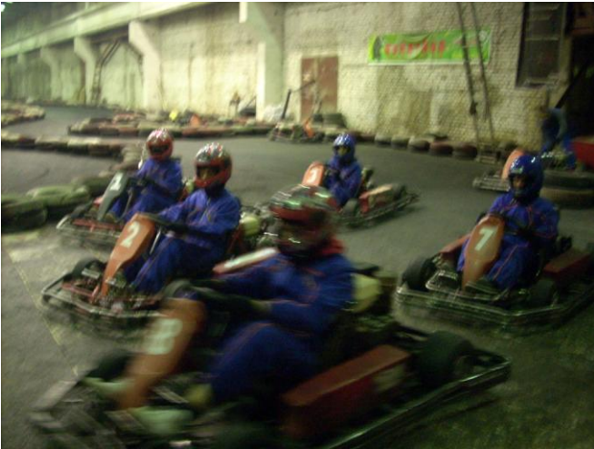
Картинг – это здорово!