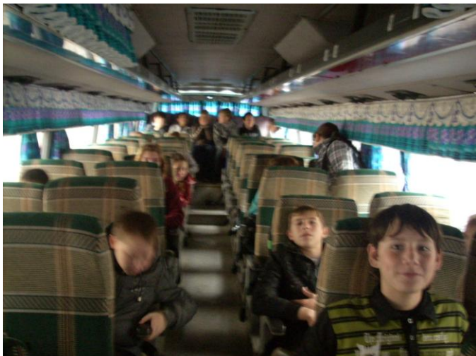
Мы отправляемся на экскурсию.

Экскурсия по городу У памятника П.И.Чистякову .доктору мед. наук, профессору