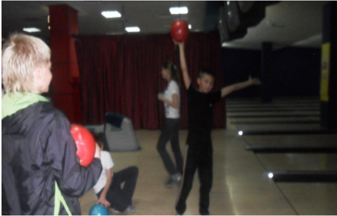
Боулинг – это интересно