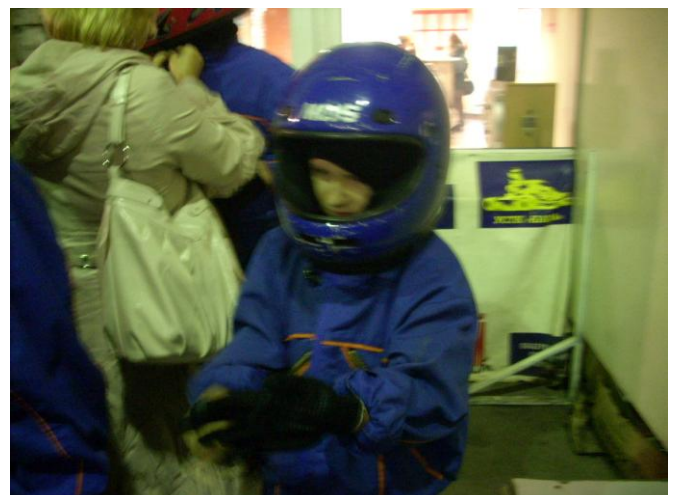
И ничего, что костюм великоват...