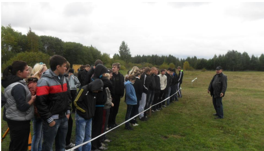
На летном поле