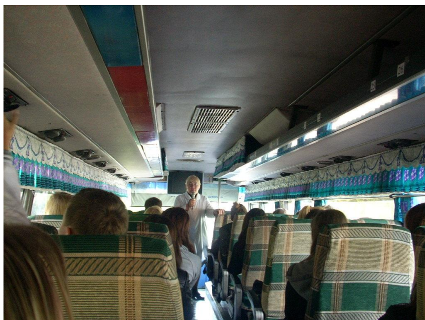
Беседа нарколога ( в автобусе)