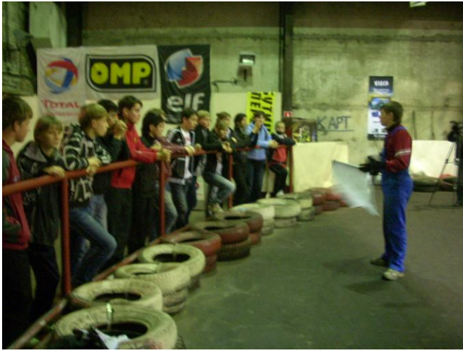
Инструктаж перед картингом