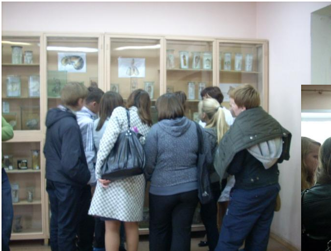
В анатомическом музее Пермской медицинской академии