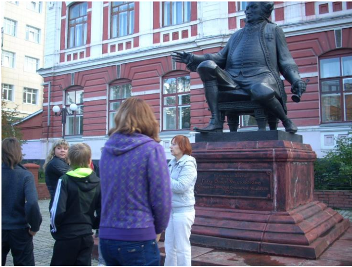
У памятника Ф.Х.Гралю