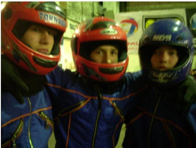
Появляются новые друзья